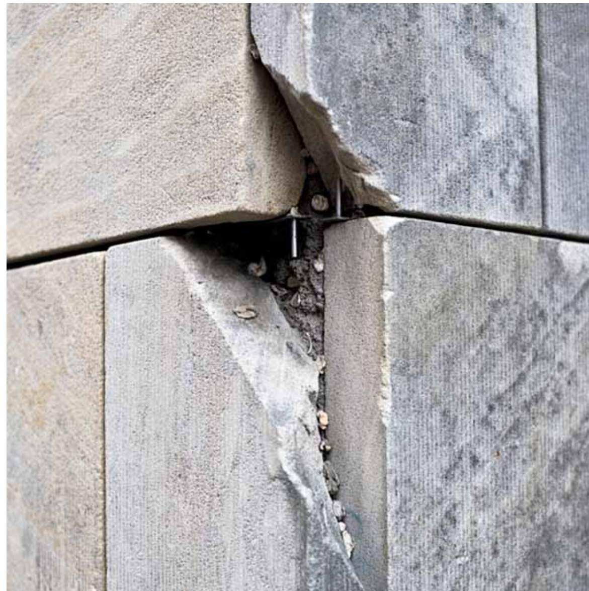
Ferita aperta con tentativi di rimarginazione _ 2009 50x50 cm _ stampa lambda su Dibond