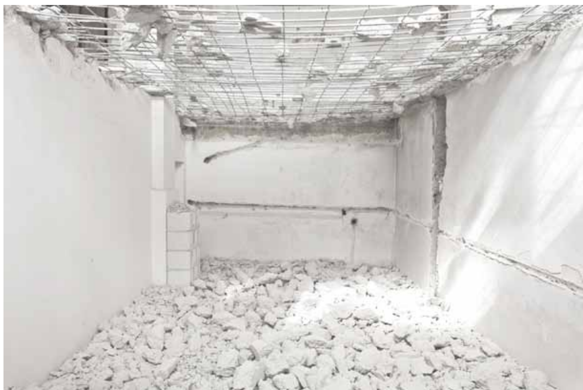
Stanza delle certezze perdute _ 2010 30x40 cm _ stampa lambda su Dibond