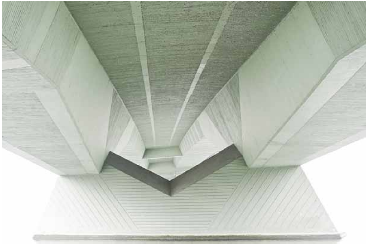
Substrato urbano 1 _ 2008 40x60 cm _ stampa lambda su Dibond