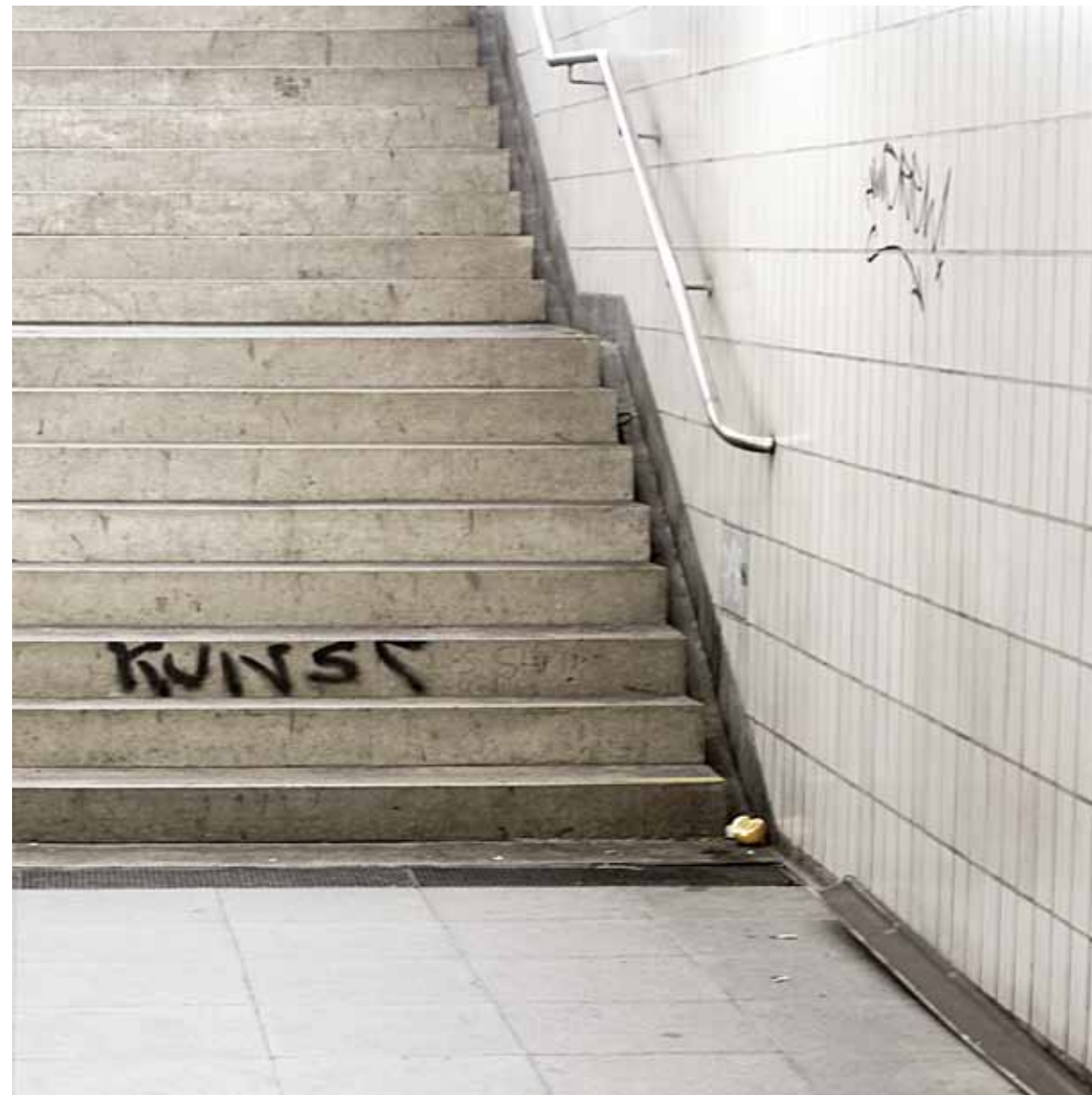
Kunst ist (B) _ 2008 stampa lambda su Dibond