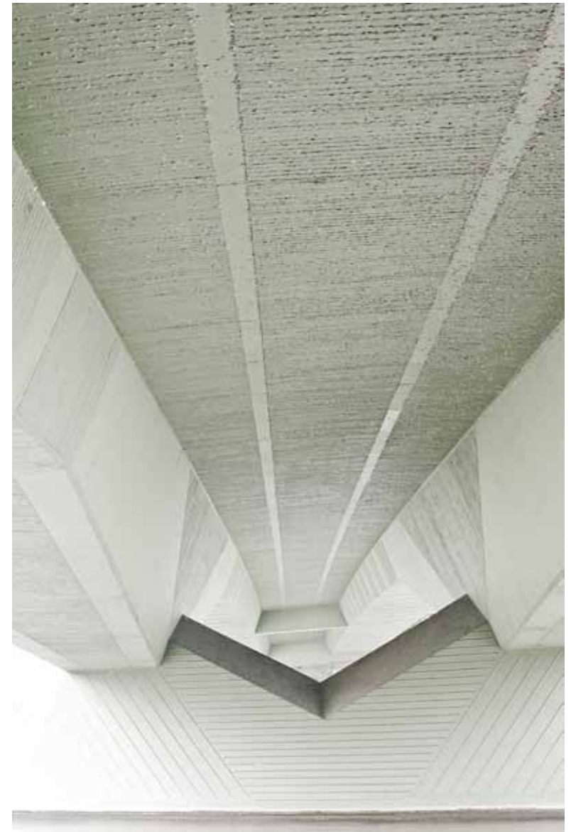
Substrato urbano 2 _ 2008 60x40 cm _ stampa lambda su Dibond