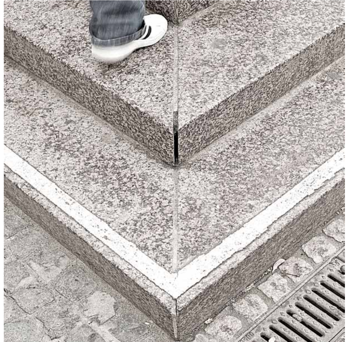
Scale parallele ma trasversali _ 2008 50x50 cm _ stampa lambda su Dibond