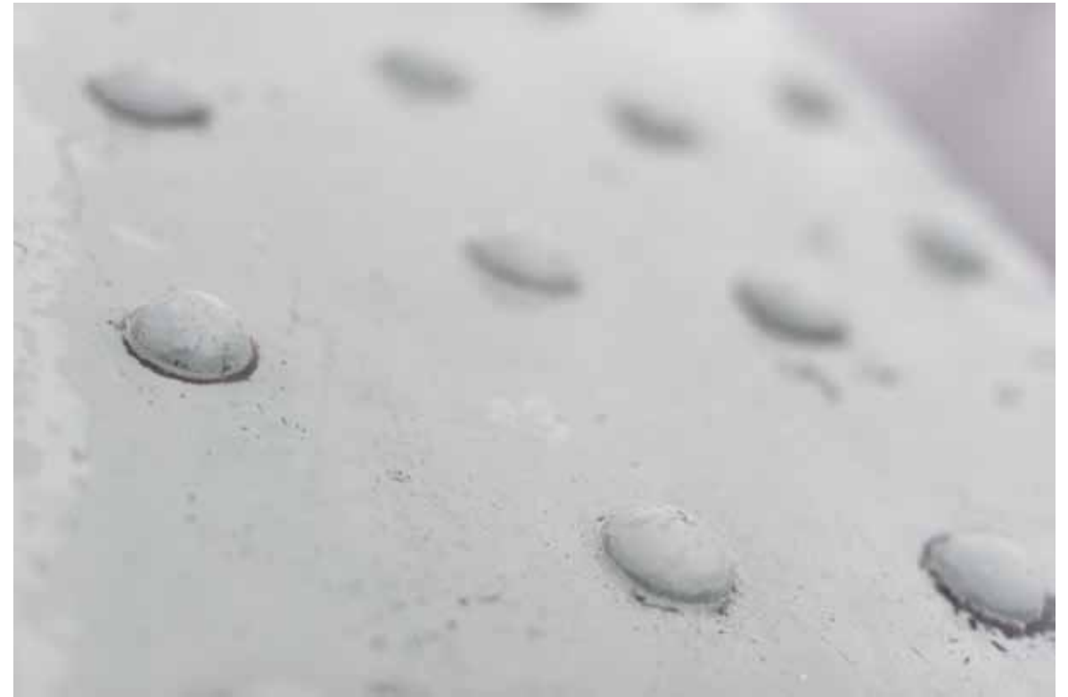
Substrato urbano 4_2008 40x60 cm _ stampa lambda su Dibond