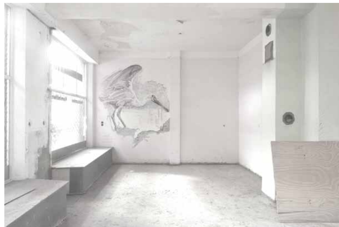
Stanza delle certezze ritrovate _ 2010 30x40 cm _ stampa lambda su Dibond