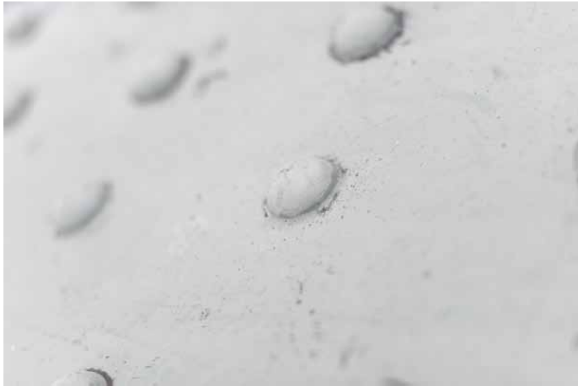
Substrato urbano 3_2008 40x60 cm _ stampa lambda su Dibond